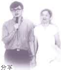
鄧達仁夫婦見證分享