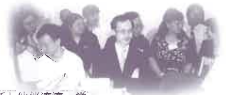
「家新」伙伴濟濟一堂

不經不覺，香港「家新」已經跨越一週年。回顧過去，不能不叫人讚嘆神的信實，「耶和華果然為我們行了大事！」過去會務的運作，依靠流動電話及家居來進行。沒想到香港「家新」一週年生辰之時，神為我們預備一個超乎人所想所求的地方作為禮物。新會址由熱心肢體免費捐贈，本來十分殘舊及一無所有的地方，經過翻新裝修後煥然一新，加上各界熱心人士捐贈傢俱設備，辦公室終於順利在五月投入服務，為未來事工奠定新的里程碑。