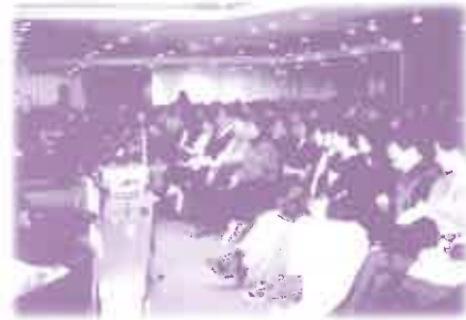
「親暱與性」聚會座無虛席